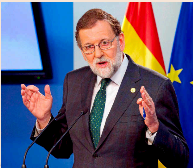
El presidente del Gobierno, Mariano Rajoy.

"Nos gustaría que los sueldos sean más elevados", declaró Rajoy, señalando su coincidencia con la postura de Báñez en esta cuestión, y enfrentada, por ello, al ministro de Economía y Competitividad, Luis de Guindos. Este último es partidario de contener la alegría en los salarios, para no correr el riesgo de que se disparen los costes de las empresas y la in-